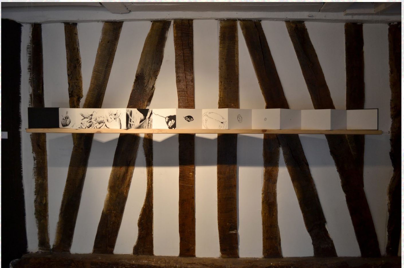
Resultat du projet Point de départ , impression et exposition de sérigraphies d'un groupe mixte d'artistes et amateurs.